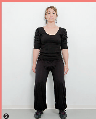
1. Appui de la colonne vertébrale contre un mur. 2. Stabilisation et renforcement abdominal et lombaire. 3. Stabilisation et renforcement du dos et des jambes. 4. Etirement des muscles dorsaux, détente, les jambes pliées.