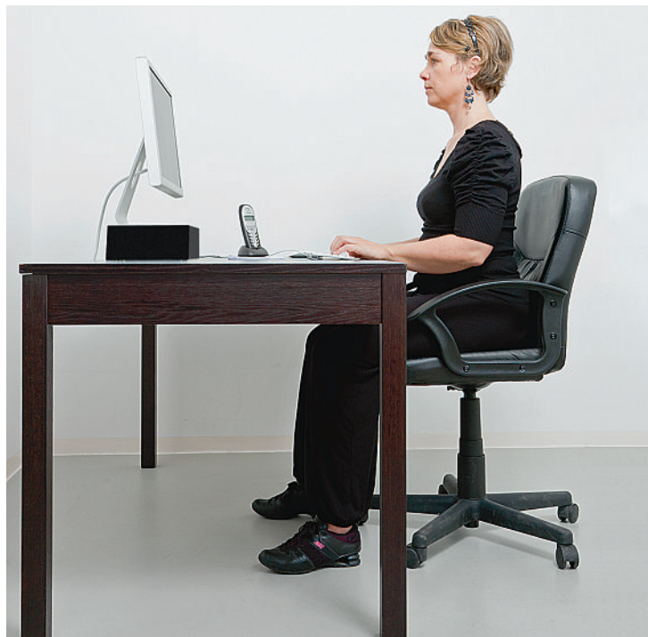
Règle des 3 angles droits (épaules, hanches, genoux). Regard sur le bord supérieur de l'écran.