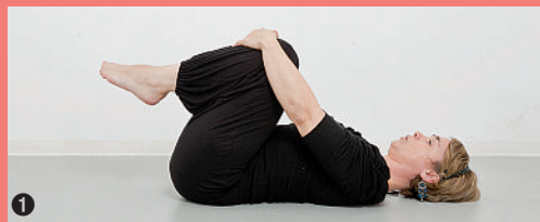
1. Etirement de la colonne vertébrale et du bassin. 2. Assouplissement de la région lombaire.