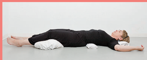
Détente: coussin ou serviette enroulée décharge les articulations douloureuses.