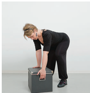
Elargir la base d'appui au sol. Contracter la musculature abdominale en expirant. Plier les jambes. Rapprocher l'objet de soi.